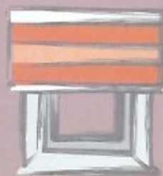
Montage vor der Nische