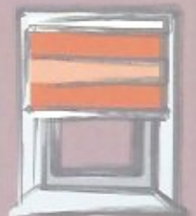
Montage in der Nische